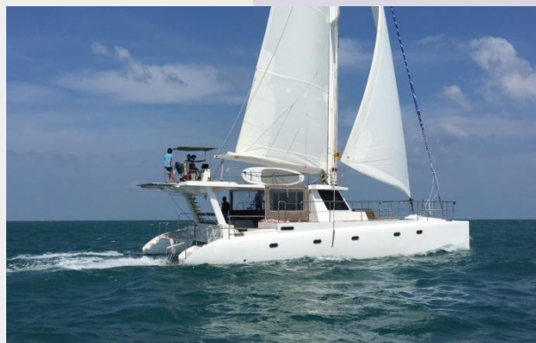
Catamarano in navigazione