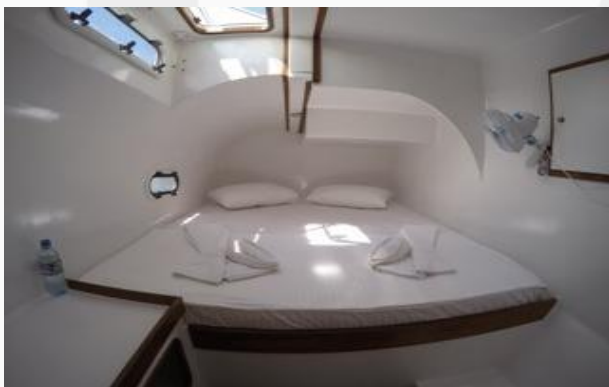
Interni cabina doppia

Catamarani con notevoli spazi comuni, comode cabine con aria condizionata e bagno privato, dissalatore per avere sempre disponibile l'acqua dolce e trattamento full board per una crociera con il massimo comfort.